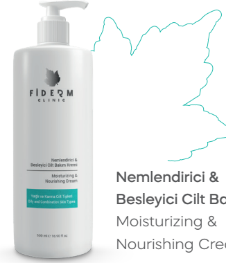
Nemlendirici & Besleyici Cilt Bakım Kremi Moisturizing & Nourishing Cream